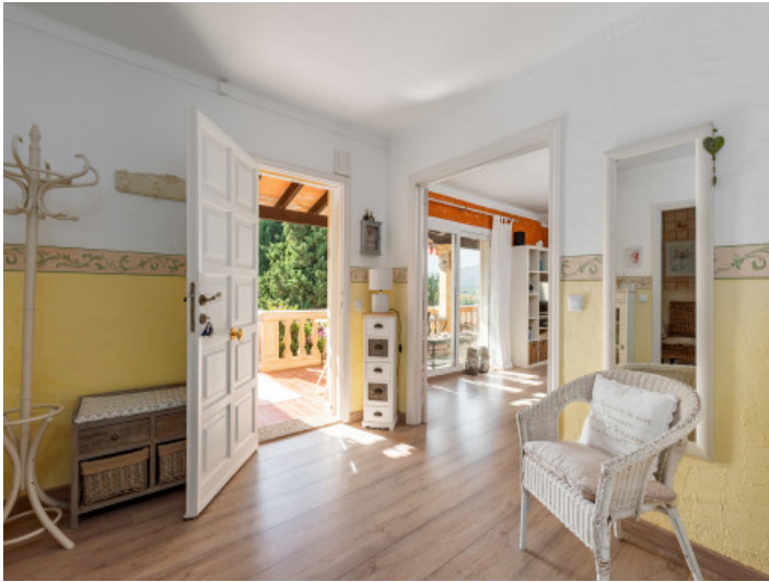
Eingangsbereich der Finca