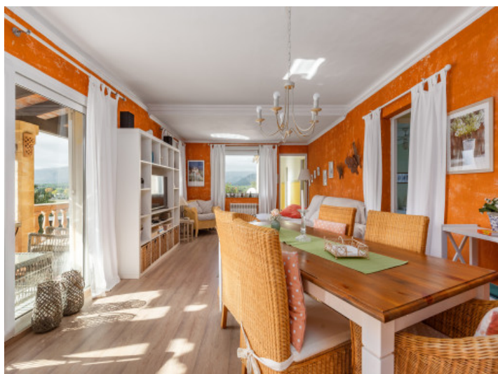
Essbereich mit Balkonzugang