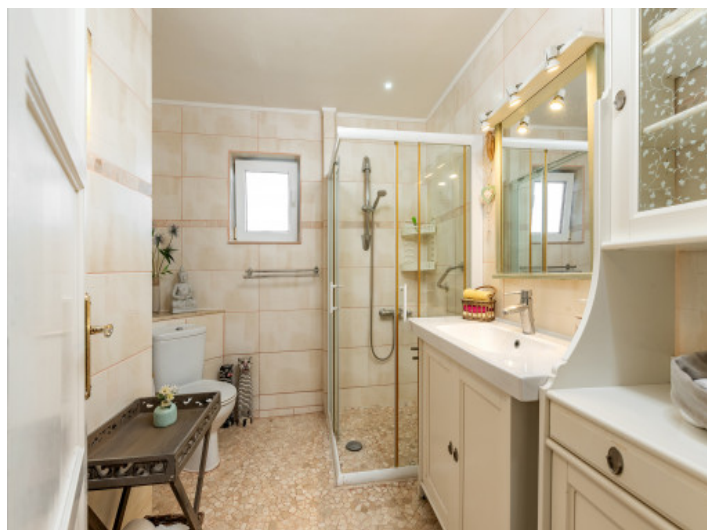
Tageslichtbadezimmer mit Dusche

Alle Angaben nach bestem Wissen. Irrtum und Zwischenverkauf vorbehalten. Dieses Exposé ist eine Vorinformation, als Rechtsgrundlage gilt allein der notariell abgeschlossene Kaufvertrag.