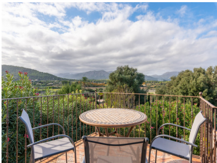
Einmaliger Landschaftsblick vom Balkon aus