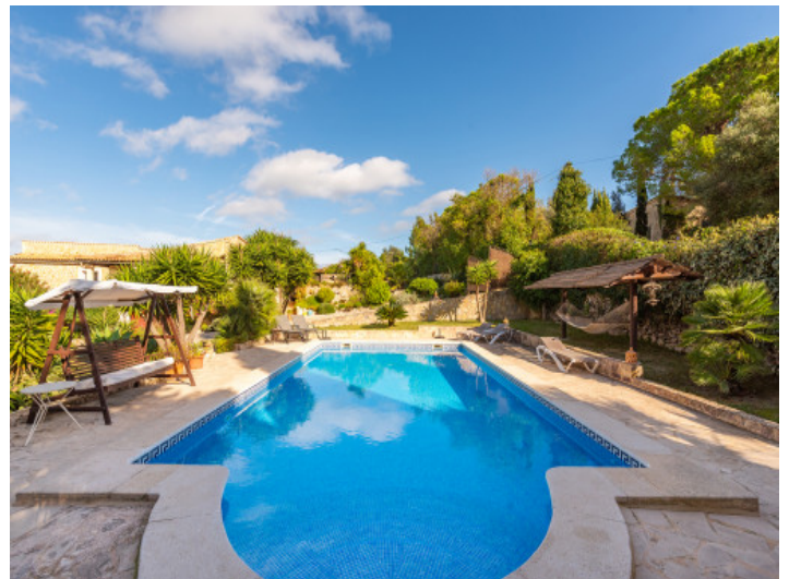
Der Pool ist von einer Terrasse umgeben