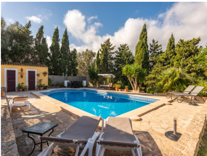
Blick vom Pool zum Poolhaus