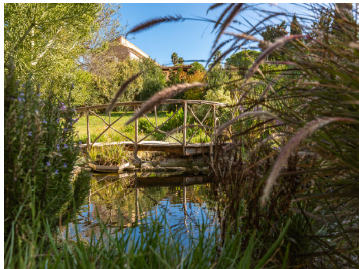
Die Finca besitzt einen Fischteich

Alle Angaben nach bestem Wissen. Irrtum und Zwischenverkauf vorbehalten. Dieses Exposé ist eine Vorinformation, als Rechtsgrundlage gilt allein der notariell abgeschlossene Kaufvertrag.