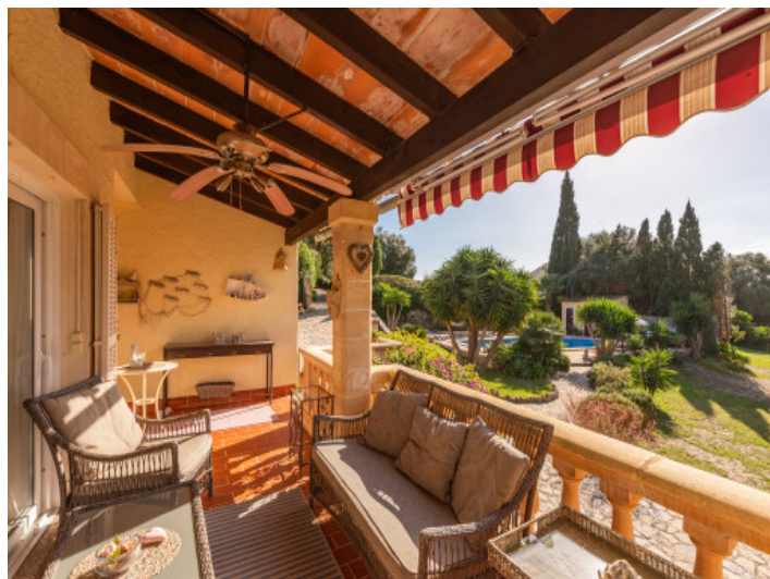
Überdachte Terrasse mit Garten- und Poolblick