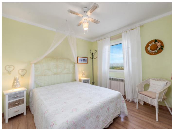
Schlafzimmer mit Heizung