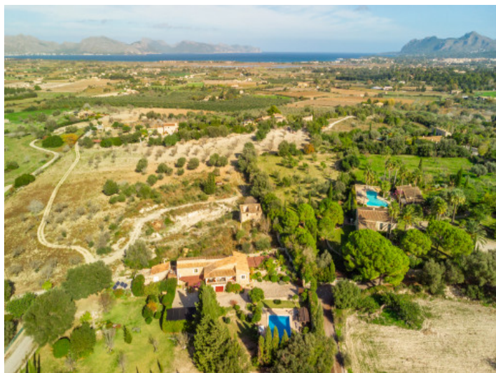
Blick von oben