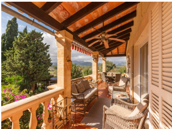
Große überdachte Terrasse mit Bergblick