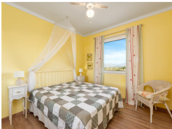
Das Schlafzimmer verfügt über einen Ventilator