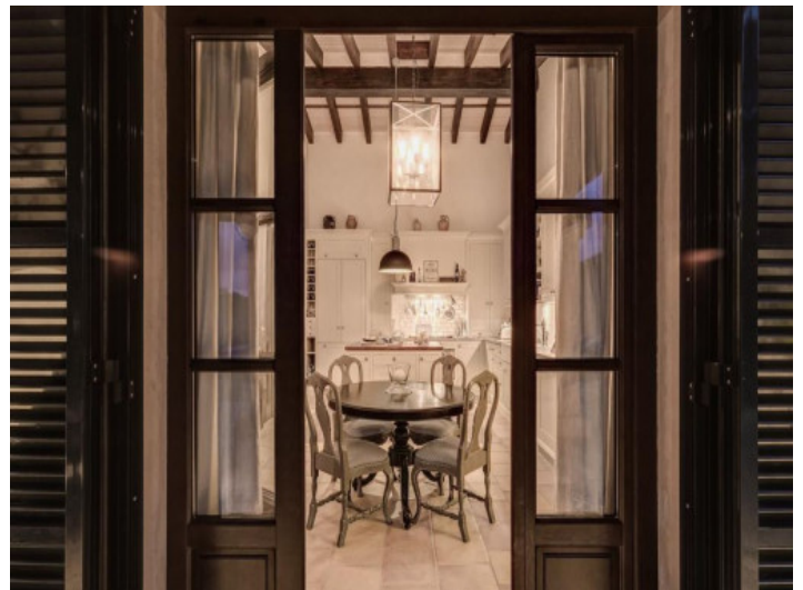
Essbereich mit offener Küche