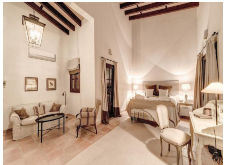
Herrschaftliches Schlafzimmer mit Sitzcke

Alle Angaben nach bestem Wissen. Irrtum und Zwischenverkauf vorbehalten. Dieses Exposé ist eine Vorinformation, als Rechtsgrundlage gilt allein der notariell abgeschlossene Kaufvertrag.