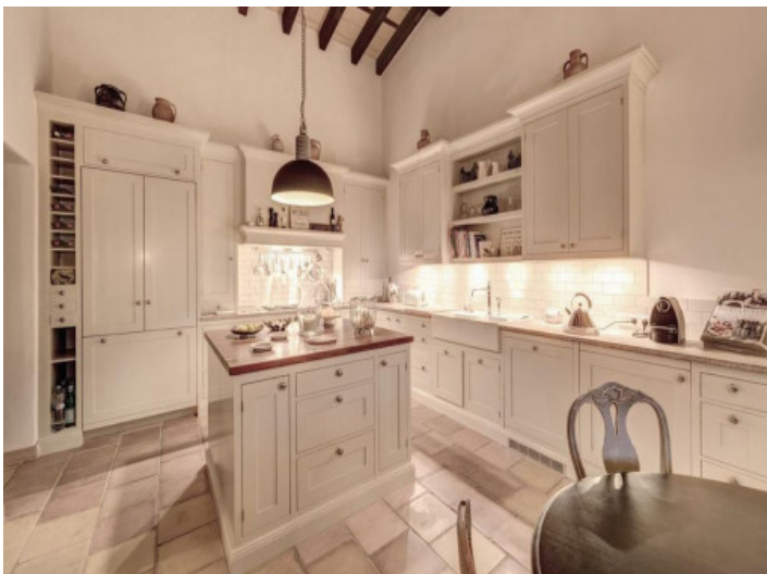
Küche mit Kochinsel