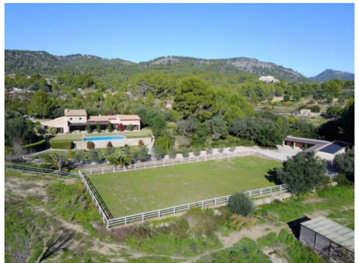
Weitläufiges Grundstück mit Pferdekoppel

Alle Angaben nach bestem Wissen. Irrtum und Zwischenverkauf vorbehalten. Dieses Exposé ist eine Vorinformation, als Rechtsgrundlage gilt allein der notariell abgeschlossene Kaufvertrag.