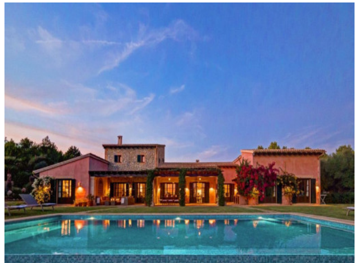
Außenansicht der exklusiven Finca