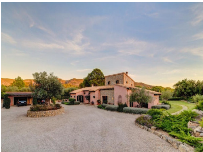
Zugang zum Anwesen