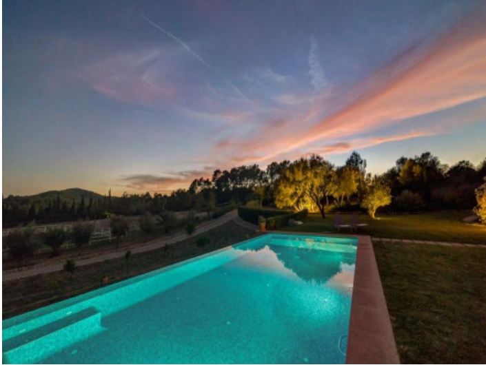
Beeindruckender Ausblick vom Pool