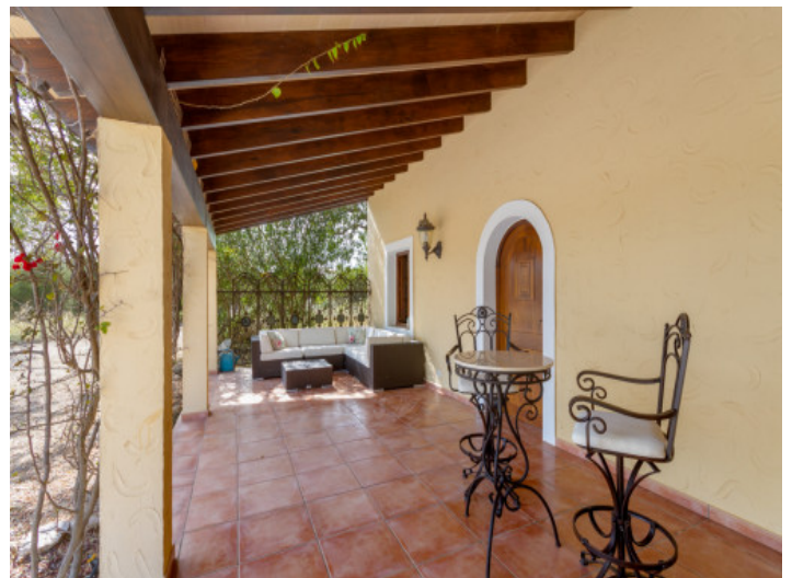
Romantische, überdachte Terrasse

Alle Angaben nach bestem Wissen. Irrtum und Zwischenverkauf vorbehalten. Dieses Exposé ist eine Vorinformation, als Rechtsgrundlage gilt allein der notariell abgeschlossene Kaufvertrag.