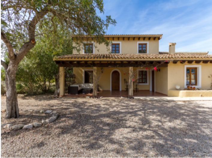
Außenansicht des Gästehauses