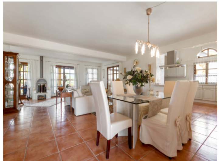
Offener Wohn- und Essbereich mit eleganter Möblierung