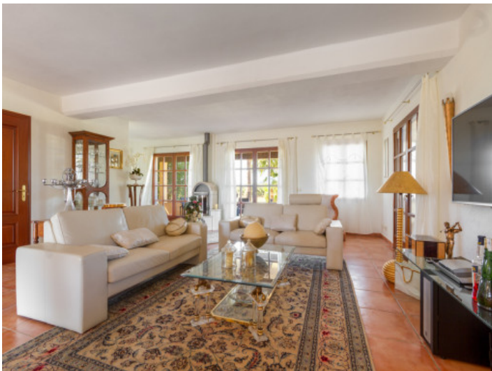
Gemütlicher Wohnbereich mit Kamin