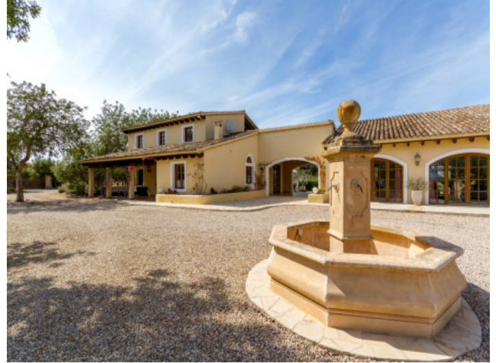
Großzügiger Außenbereich und Zugang zur Finca