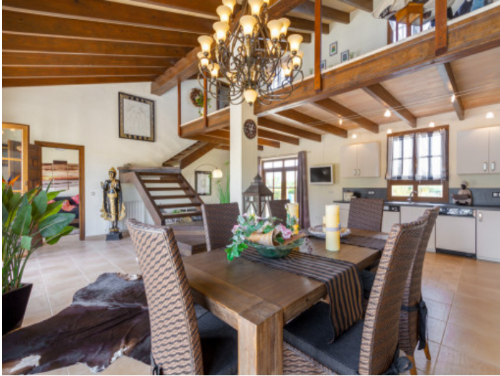
Offener Essbereich mit einzigartiger Möblierung