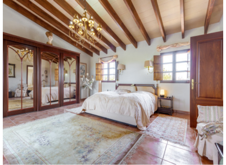
Zauberhaftes Schlafzimmer mit Badezimmer en Suite