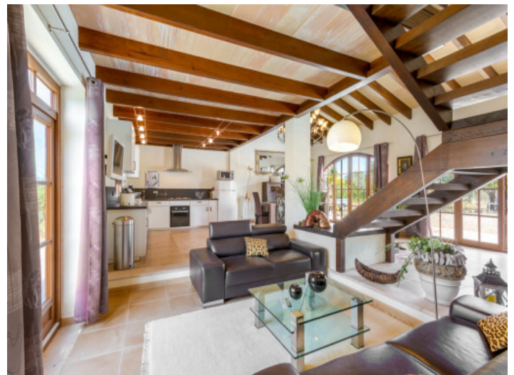
Wohnbereich im Nebenhaus mit großen Fenstern

Alle Angaben nach bestem Wissen. Irrtum und Zwischenverkauf vorbehalten. Dieses Exposé ist eine Vorinformation, als Rechtsgrundlage gilt allein der notariell abgeschlossene Kaufvertrag.