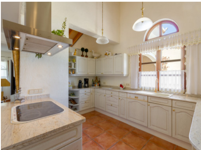
Charmante Landhausküche mit Kochinsel