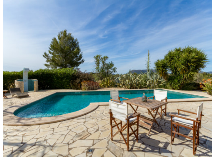
Sonniger Poolbereich mit Außendusche