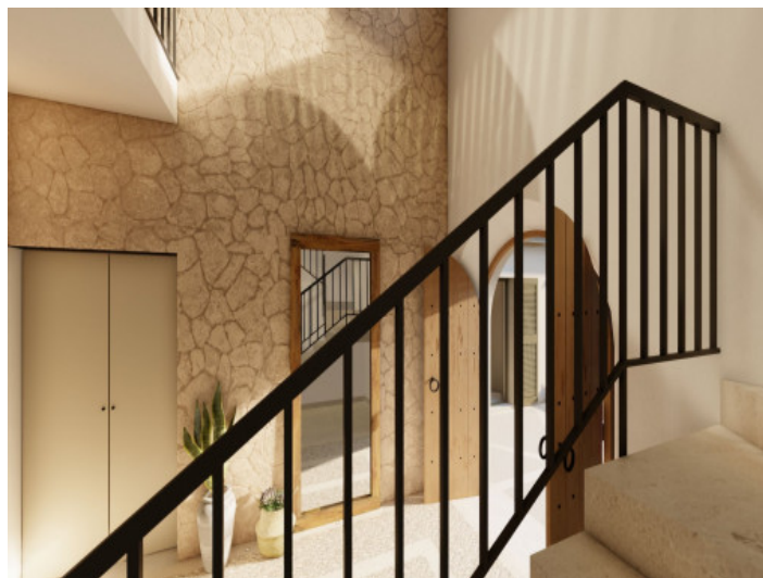
Aufgang zum Obergeschoss