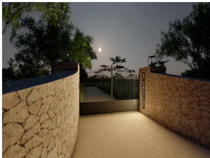
Einfahrt zur Finca