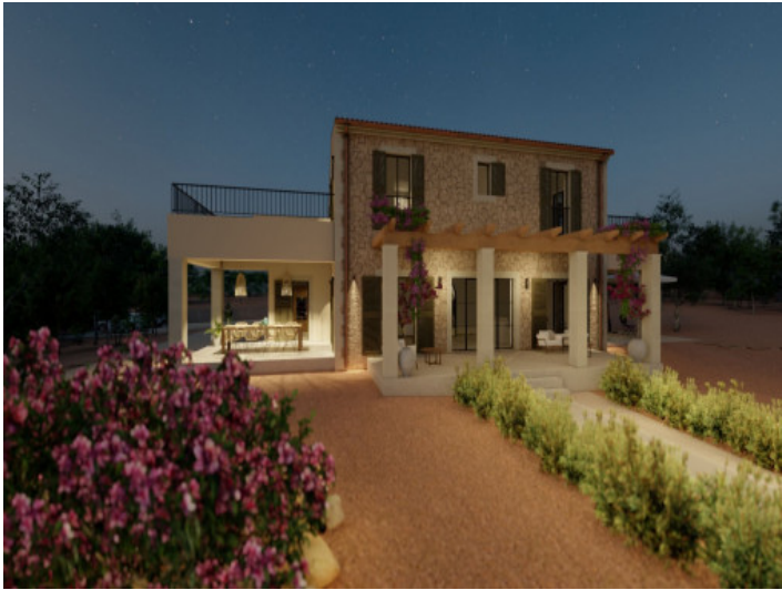
Ansicht auf die Finca