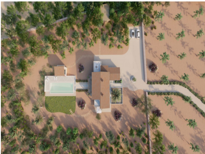
Das Objekt von Oben