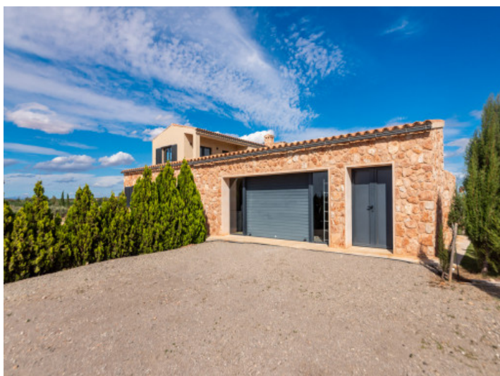
Garage und Außenstellplätze