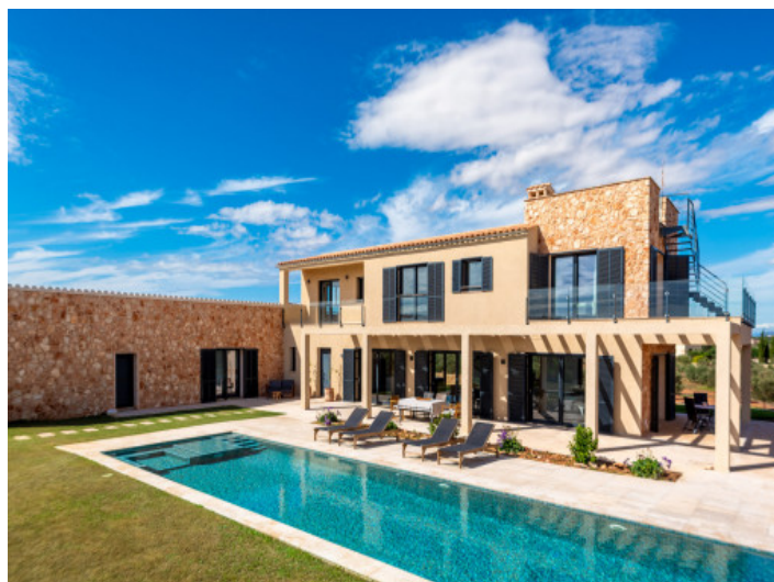
Außenansicht der Finca

Alle Angaben nach bestem Wissen. Irrtum und Zwischenverkauf vorbehalten. Dieses Exposé ist eine Vorinformation, als Rechtsgrundlage gilt allein der notariell abgeschlossene Kaufvertrag.