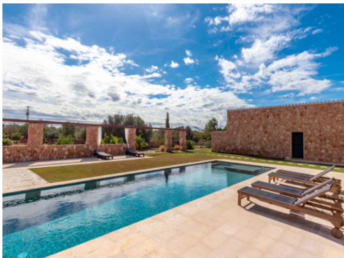
Sehr gepflegter Außenbereich