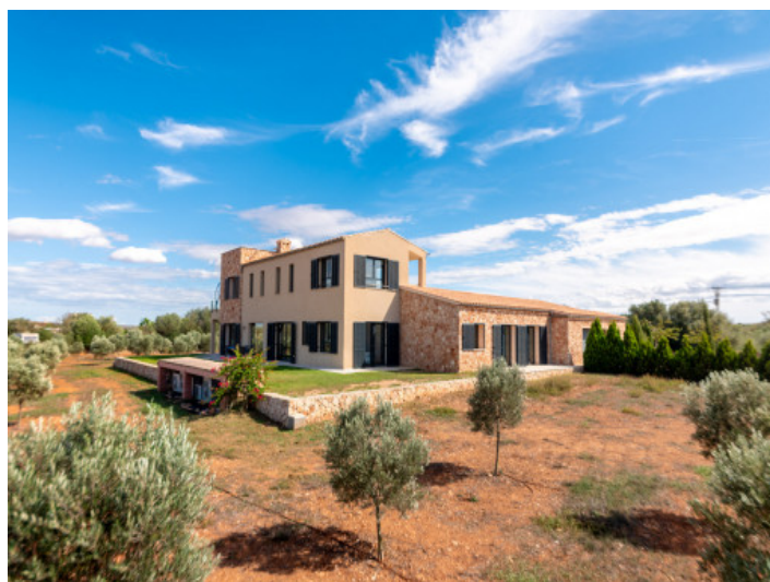
Garten und Fassade