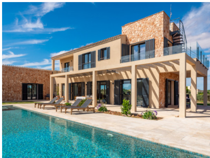
Sehr schöne Finca