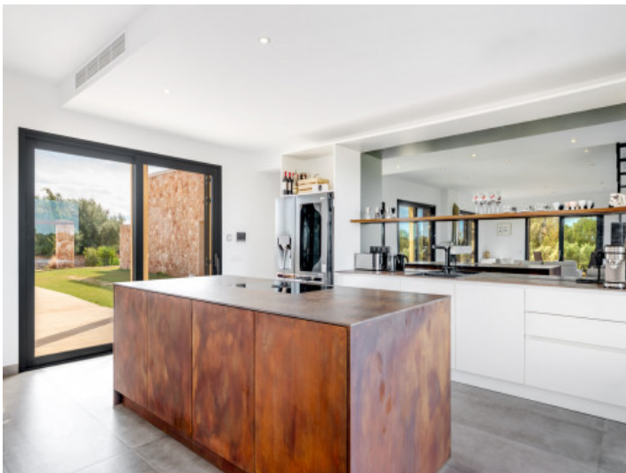
Küche mit Kochinsel