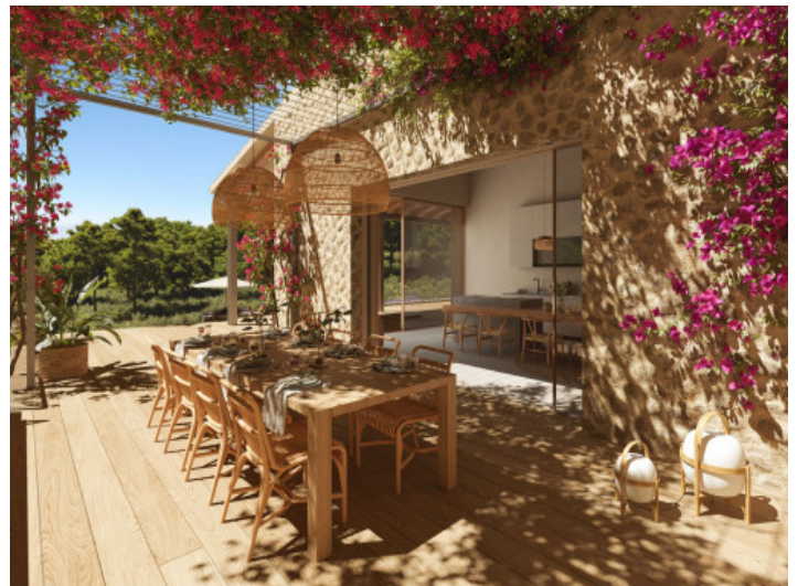
Idyllischer Essbereich im Freien