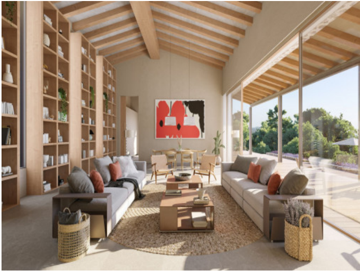
Lichtdurchfluteter Wohnbereich mit hohen Decken