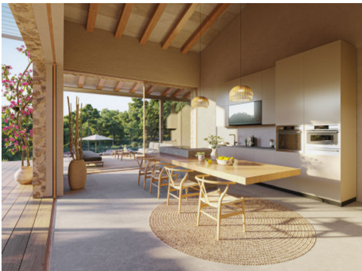
Fliessender Übergang zur offenen Küche