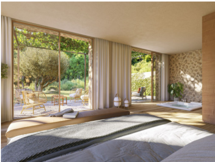
Direkter Zugang nach Außen