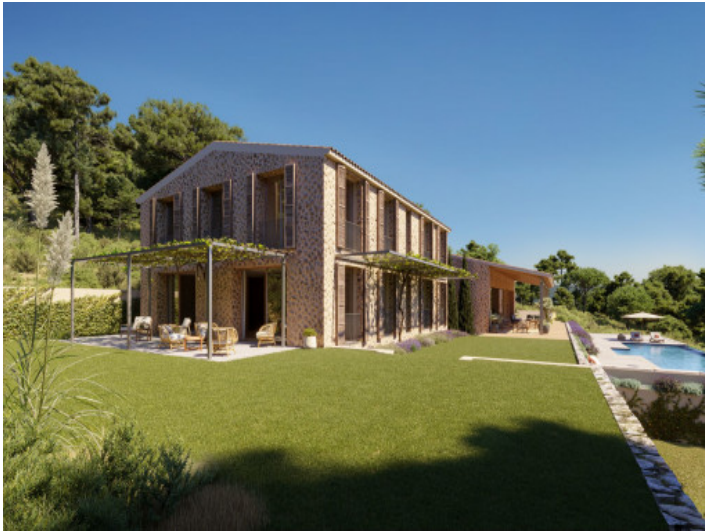
Herrlich angelegter Garten