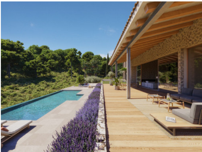
Paradiesischer Terrassen- und Poolbereich