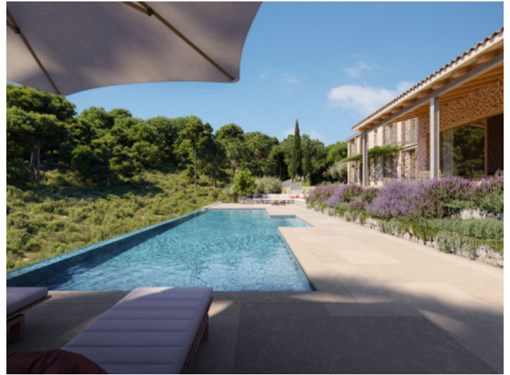
Poolbereich in absoluter Privatsphäre