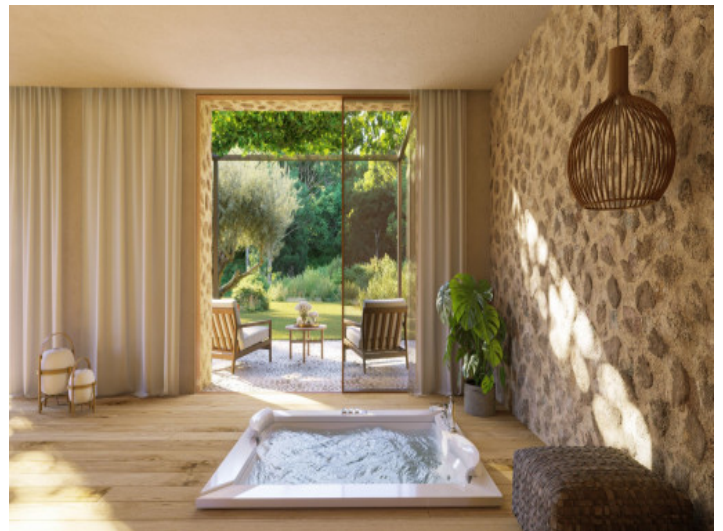
Whirlpool im Schlafzimmer