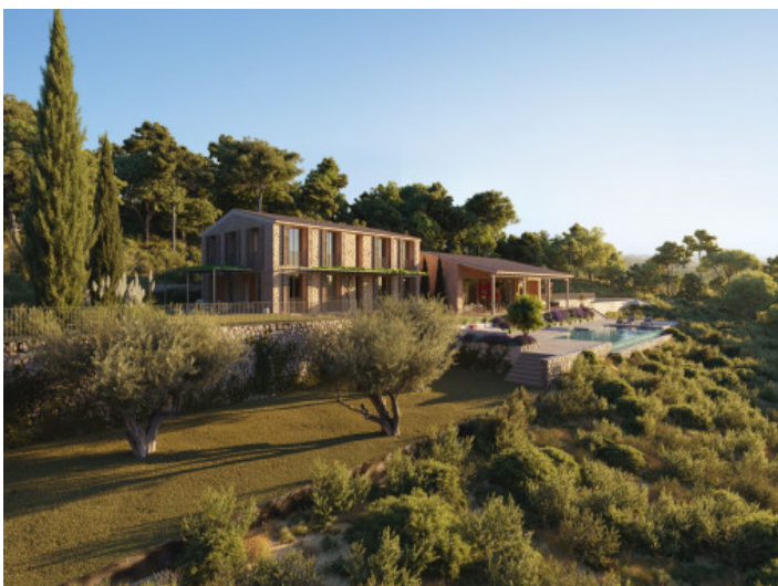
Finca in ruhiger Lage