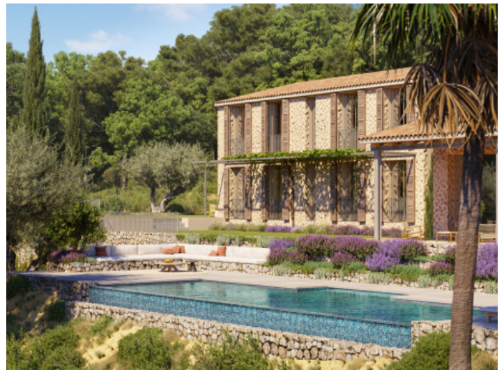
Außenansicht der Finca