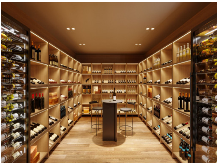
Fantastische, eigene Bodega