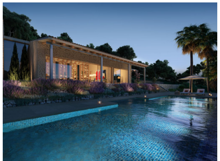
Finca und Pool bei Nacht

Alle Angaben nach bestem Wissen. Irrtum und Zwischenverkauf vorbehalten. Dieses Exposé ist eine Vorinformation, als Rechtsgrundlage gilt allein der notariell abgeschlossene Kaufvertrag.