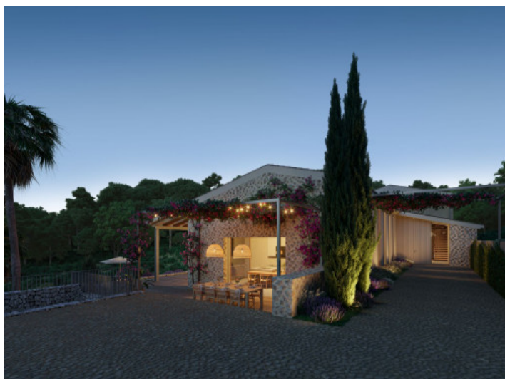
Finca bei Nacht

Alle Angaben nach bestem Wissen. Irrtum und Zwischenverkauf vorbehalten. Dieses Exposé ist eine Vorinformation, als Rechtsgrundlage gilt allein der notariell abgeschlossene Kaufvertrag.